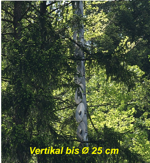
Vertikal bis Ø 25 cm